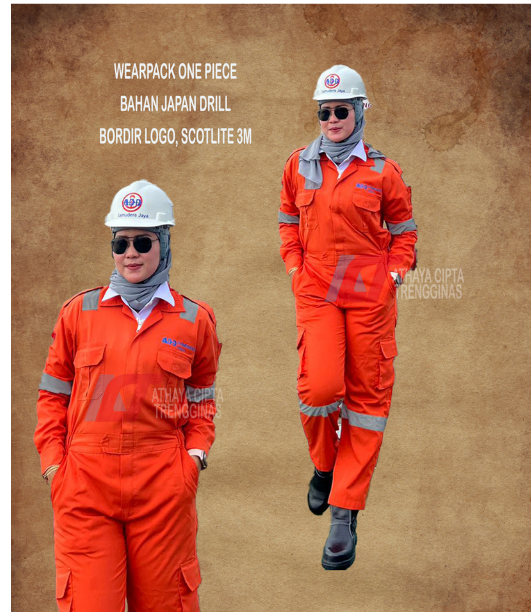
WEARPACK ONE PIECE BAHAN JAPAN DRILL BORDIR LOGO, SCOTLITE 3M