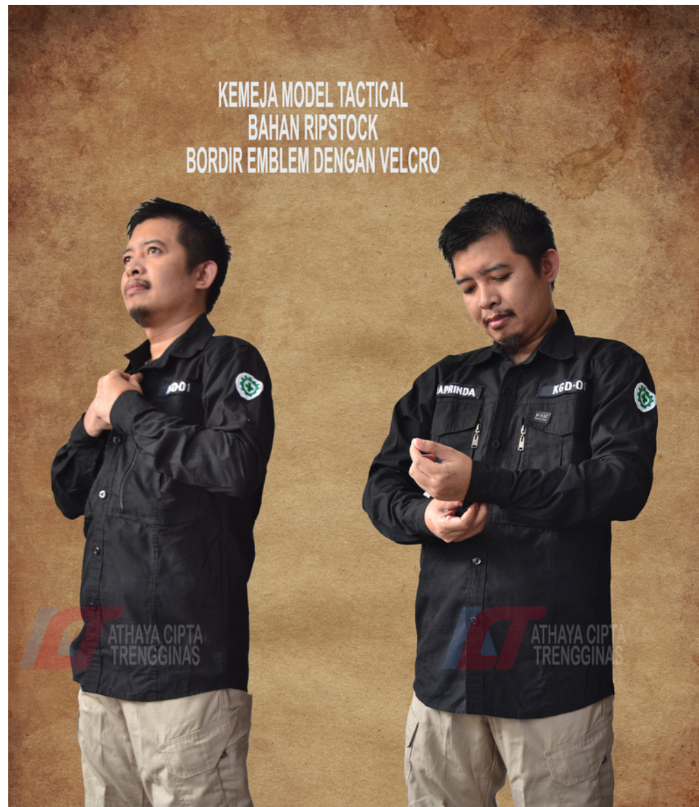
KEMEJA MODEL TACTICAL BAHAN RIPSTOCK BORDIR EMBLEM DENGAN VELCRO